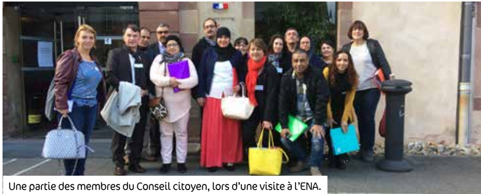
Une partie des membres du Conseil citoyen, lors d'une visite à l'ENA.

Le Conseil citoyen des Pins a été créé en 2015 et est accompagné depuis par le Centre Socioculturel Robert Schuman. Ce Conseil citoyen est une instance participative composée d'habitants du quartier. Son rôle consiste à faire valoir les besoins et problèmes sociaux du quartier, à avancer des propositions d'actions en cohérence avec les objectifs du Contrat de Ville, à participer à l'évaluation des actions, à prendre en charge l'animation de certaines actions et activités... « Au départ, il s'agit d'une injonction