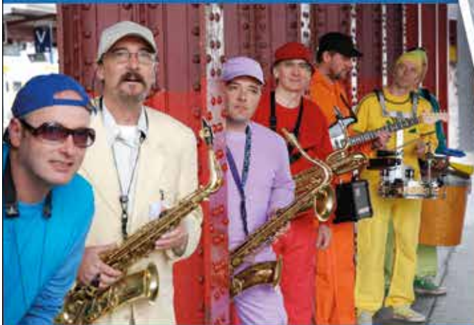
Les Tapageurs Animations