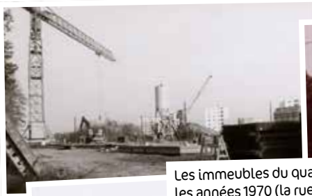
Les immeubles du quartier ont été construits dans les années 1970 (la rue Thomas Becquet en 1971, la rue de la Piscine en 1973, la rue des Carrières en 1977).