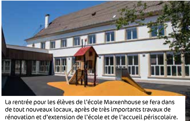
La rentrée pour les élèves de l'école Marxenhouse se fera dans de tout nouveaux locaux, après de très importants travaux de rénovation et d'extension de l'école et de l'accueil périscolaire.

Ce sont près de 585 000 euros qui ont été investis cet été dans les locaux dédiés à l'enfance et à l'éducation à Haguenau. Citons d'importants travaux d'amélioration du confort thermique à l'école maternelle Bellevue et à la Maison de l'Enfance, la rénovation (peinture, revêtement) dans les écoles Saint-Georges, Les Pins, à la Maison de l'Enfance et au périscolaire de la Musau, la réfection des corniches de l'école élémentaire Saint-Nicolas... D'autres travaux seront réalisés pendant les vacances de la Toussaint et concerneront les écoles Schloessel, Saint-Georges et de Marienthal.