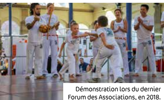
Démonstration lors du dernier Forum des Associations, en 2018.

Les 12 et 13 septembre, le Forum des Associations réunira les associations haguenviennes, qu'elles soient caritatives, sportives, culturelles... Cet événement permettra de découvrir les activités et actions menées par les nombreux bénévoles associatifs. L'occasion de saluer la passion et l'engagement de ces acteurs de la vie de Haguenau, parfois durement touchés par la crise actuelle.