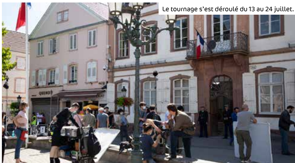
Le tournage s'est déroulé du 13 au 24 juillet.

Depuis plusieurs années, Haguenau prend des allures de studio de cinéma en accueillant des tournages tels que celui de La Fille de l'Air , le téléfilm Famille et turbulences , ou encore un épisode de la série Band of Brothers . En juillet, l'équipe de tournage de la série Une Affaire Française* s'est installée en ville, précisément dans l'ancien tribunal. Nous vous emmenons en coulisses.