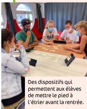
Des dispositifs qui permettent aux élèves de mettre le pied à l'étrier avant la rentrée.

accueil périscolaire à l'école maternelle Schloessel. De plus, un accueil sur le temps du midi sera proposé à l'école maternelle Saint-Joseph (géré par le Centre socioculturel du Langensand).