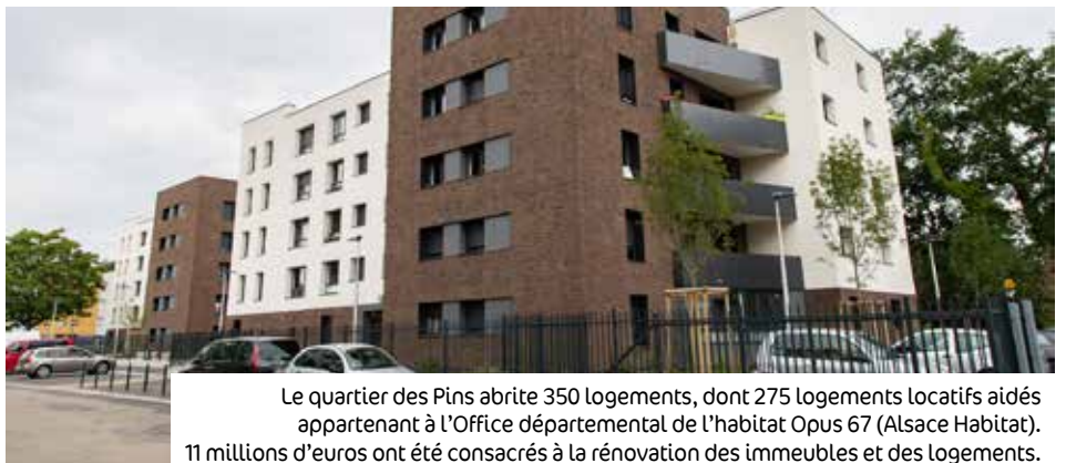
Le quartier des Pins abrite 350 logements, dont 275 logements locatifs aidés appartenant à l'Office départemental de l'habitat Opus 67 (Alsace Habitat). 11 millions d'euros ont été consacrés à la rénovation des immeubles et des logements.

Une faible densité de logements (20 en tout), des logements à prix maîtrisés et réservés à de l'accession aidée, un quota d'espaces verts avec la préservation des arbres... Tout cela explique l'accord trouvé entre Heria et la Ville de Haguenau.