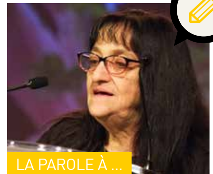
LA PAROLE À ...

Les actions à l'initiative des différents acteurs associatifs du quartier se sont multipliées ces dernières années : Journée du Sport en collaboration avec le bailleur social, Fête de la Soupe , spectacles jeune public avec le Relais culturel... Le CSC Robert Schuman et l'association JEEP ont aussi travaillé ensemble au projet Mise en Bouche : des ateliers de cuisine solidaire ayant pour objectif de travailler au savoir-être comme au savoir-faire d'habitants du quartier. Des bibliothèques de rue ont été mises en place par la JEEP avec la bibliothèque de la Maison de Quartier des Pins pour favoriser l'accès à la lecture des habitants. De plus, l'association Unis Cité, qui promeut le service civique, s'est installée au 40, rue des Carrières en 2018, ce qui a permis