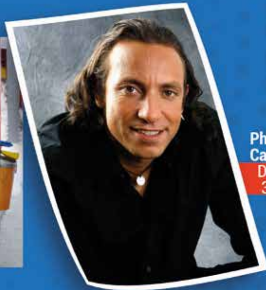
Philippe Candeloro Dimanche 30 août

Le plus grand Salon de l'Habitat et de l'Automobile en Alsace du Nord !