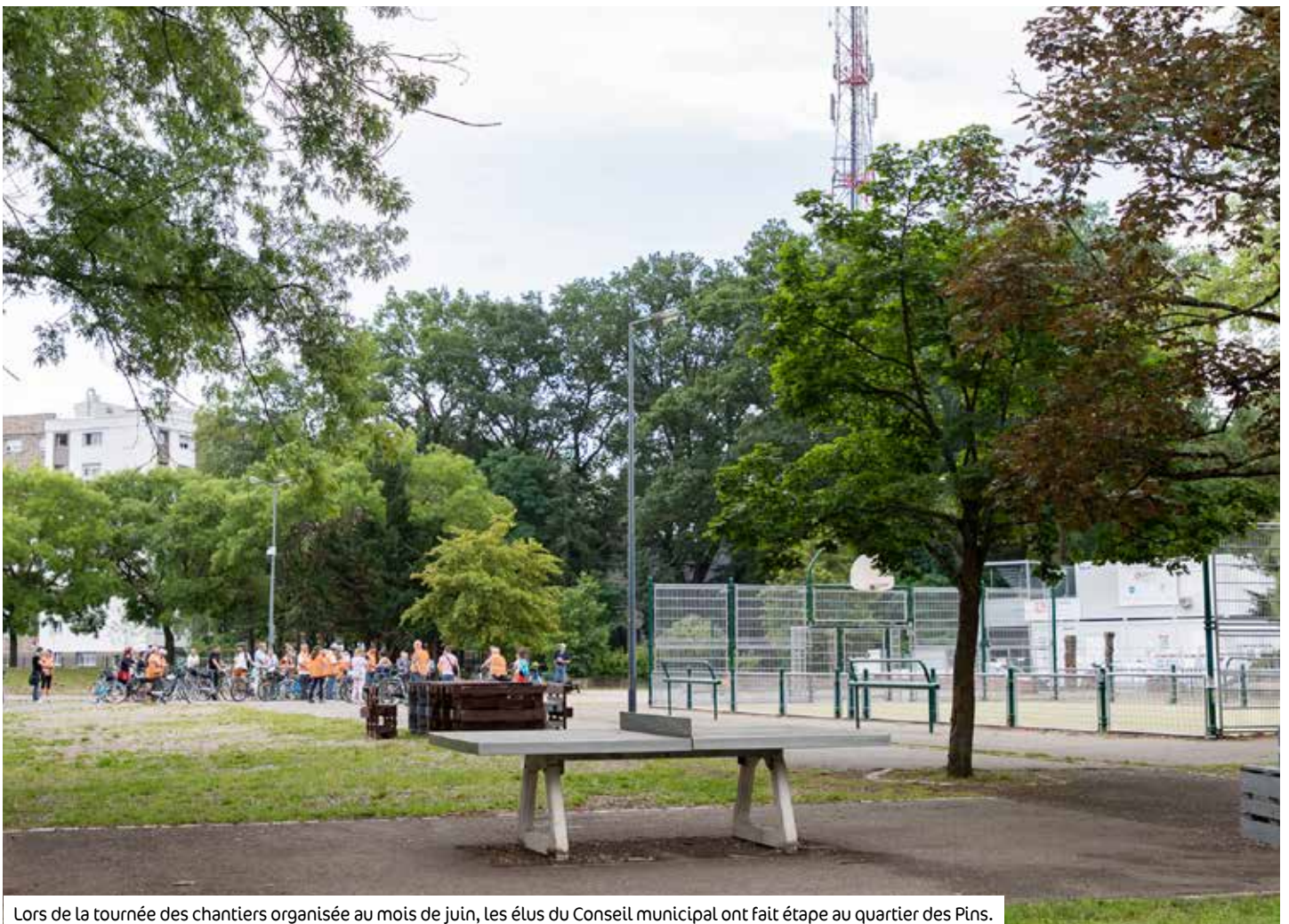
Lors de la tournée des chantiers organisée au mois de juin, les élus du Conseil municipal ont fait étape au quartier des Pins.

C 'est un des lieux symboliques du quartier. La place centrale est un espace arboré où les gens se rencontrent, où les aires de jeux et le city-stade accueillent les jeunes enfants et les plus grands. C'est aussi un jardin partagé qui fait la fierté des habitants. Pour parfaire la transformation globale du quartier, il devenait nécessaire de restructurer et de sécuriser cette place. C'est ainsi que le Conseil municipal, réuni le 10 juillet, a approuvé le projet de réaménagement de cet espace privilégié de vie et d'échange.