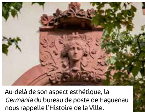
Au-delà de son aspect esthétique, la Germania du bureau de poste de Haguenau nous rappelle l'Histoire de la Ville.

Ils passent souvent inaperçus et sont pourtant présents en nombre dans nos rues : les mascarons, figures de pierre souvent humaines et intégrées à l'architecture, décorent fenêtres et balcons de nos bâtiments. Une particularité propre à l'Histoire de Haguenau qui, après avoir été détruite dans les années 1600, fut reconstruite au XVIII e , au cœur du siècle des Lumières qui plaçait l'Homme au centre du monde. De nombreuses têtes semblent ainsi veiller sur les passants, sans que ces derniers n'y prêtent attention. Pour les découvrir et les admirer, il ne suffit pourtant que de lever... la tête, bien sûr !