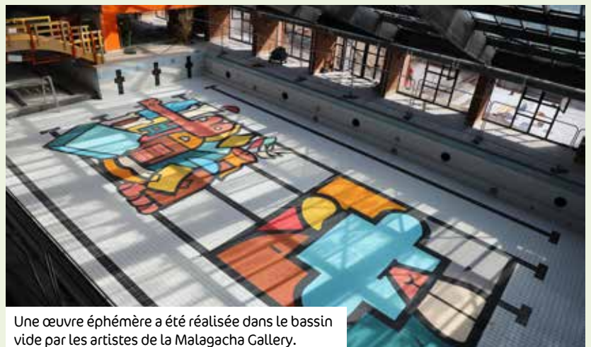
Une œuvre éphémère a été réalisée dans le bassin vide par les artistes de la Malagacha Gallery.