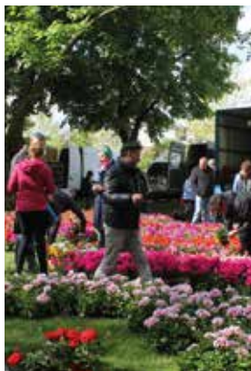
Espace Jardin 2019.

Malgré la crise, la Ville de Haguenau met tout en œuvre pour vous proposer des animations variées, dans le respect des règles sanitaires. Cependant, les prochaines manifestations sont susceptibles d'être adaptées, reportées voire annulées. Rendez-vous sur le site www.sortirahaguenau.fr ou sur la page Facebook de la Ville pour vous tenir informés !