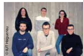
L'équipe du projet Ice'Tup (photo prise avant la mise en place des mesures sanitaires actuelles).

Les départements Qualité, Logistique Industrielle et Organisation des IUT de France organisent chaque année un concours de « Jeunes Créateurs d'Unités de Production » ouvert aux étudiants préparant le DUT. L'équipe haguenovienne a décroché la seconde place avec son Ice'Tup. Une boîte isotherme permettant de conserver son repas à la température souhaitée pendant plusieurs heures et de le manger facilement.