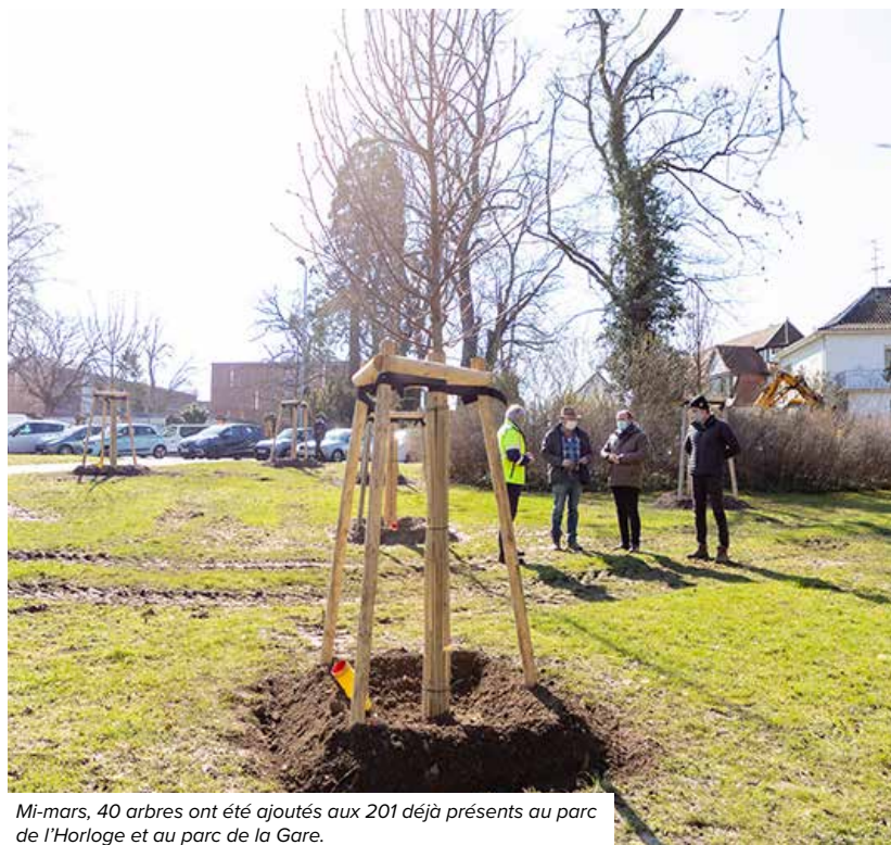
Mi-mars, 40 arbres ont été ajoutés aux 201 déjà présents au parc de l'Horloge et au parc de la Gare.