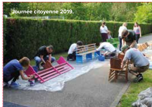
Journée citoyenne 2019.