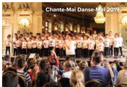
Chante-Mai Danse-Mai 2019.

Annulé en 2020 en raison du confinement, le traditionnel festival de chant scolaire Chante-Mai Danse-Mai est de retour avec une édition repensée intitulée De loin en chœur . En cette année exceptionnelle, l'AOS de Haguenau, le Centre de classes musicales Les Aliziers, l'association Approchants et la radio Accent 4 vous donnent rendez-vous pour une rencontre chantante intergénérationnelle, intégrant des EHPAD de proximité, et retransmise à la radio. Un concert à écouter en direct sur Accent 4 (fréquence 96.6) ou sur le site blog.accent4.com .