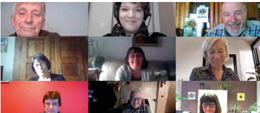
Les échanges entre la Ville, l'Office des Sports et Loisirs et les associations se poursuivent, même en visioconférence !

La restitution des résultats du sondage a été faite courant mars par les élus aux associations sous forme de visioconférences. Dans un second temps, des ateliers de travail thématiques seront organisés lors d'un événement dénommé « Les Assises de la Vie Associative », dès lors que la situation sanitaire le permettra. Quatre thèmes ont été retenus pour ces ateliers : les adhérents et les bénévoles ; les ressources financières ; la promotion et la communication ; les locaux et le matériel. Les réflexions issues de ces ateliers conduiront à la validation d'un plan d'action , pour aider de façon concrète et adaptée nos précieuses associations.