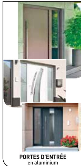
PORTES D'ENTRÉE en aluminium

SÉCURITÉ - ISOLATION - DESIGN avec la nouvelle gamme de portes KOVACIC