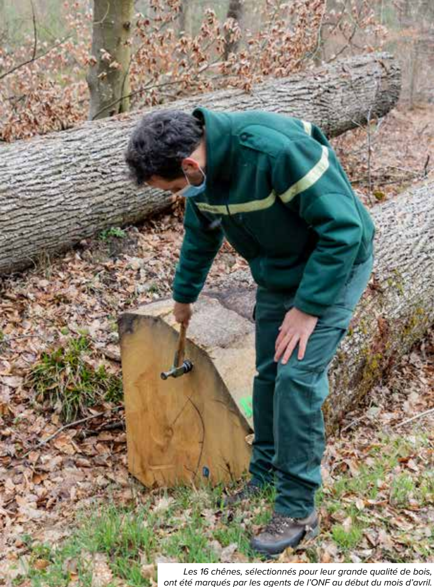
Les 16 chênes, sélectionnés pour leur grande qualité de bois, ont été marqués par les agents de l'ONF au début du mois d'avril.

* Sous réserve de l'évolution de la situation sanitaire.