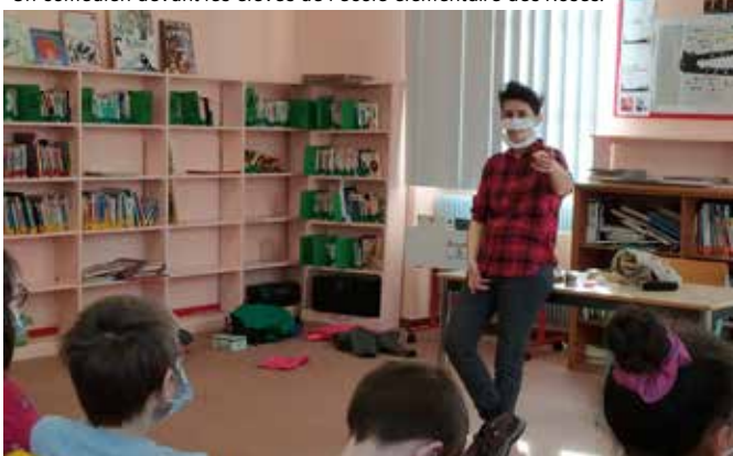
Un comédien devant les élèves de l'école élémentaire des Roses.

Des compagnies artistiques ont adapté leurs spectacles pour qu'ils puissent être joués dans les écoles, dans le respect des règles sanitaires. En février, le Théâtre de Romette est allé à la rencontre des élèves des écoles élémentaires Saint-Nicolas, Saint-Georges et des Roses. Fin mars, ce sont les élèves de l'école maternelle Schloessel qui ont eu le privilège d'assister au spectacle de la compagnie La Bicaudale. Le Relais culturel continue d'ouvrir les portes à la culture pour les plus jeunes, et ainsi de les ouvrir au monde !