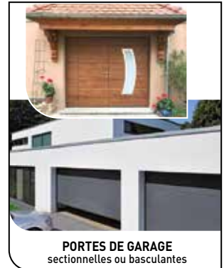
PORTES DE GARAGE sectionnelles ou basculantes

Bénéficiez toujours de la TVA à 5,5 %* *selon les produits et la législation en vigueur