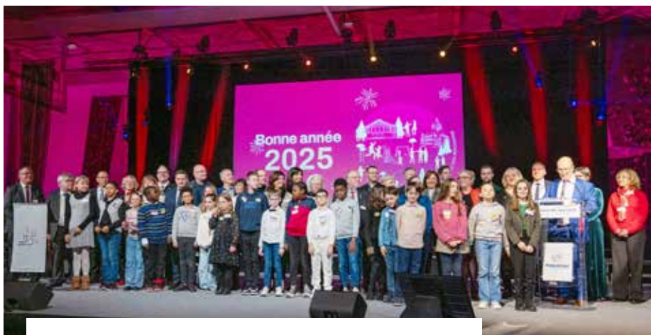
Réunis sur scène, les élus du Conseil municipal et les membres du Conseil Municipal des Enfants.

Le vendredi 17 janvier, l'Espace Sportif Sébastien Loeb a accueilli la cérémonie des vœux de la Ville de Haguenau. Placée sous le signe de la rencontre et du partage, cette soirée a réuni environ 1 200 personnes, venues revivre les moments marquants de 2024 et découvrir les projets qui dessineront l'année 2025.