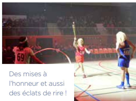
Des mises à l'honneur et aussi des éclats de rire !

leurs performances aux Jeux olympiques de 2024. Le Maire, Claude Sturni, a salué leur engagement et leurs exploits, rappelant l'importance du sport dans la vie locale.