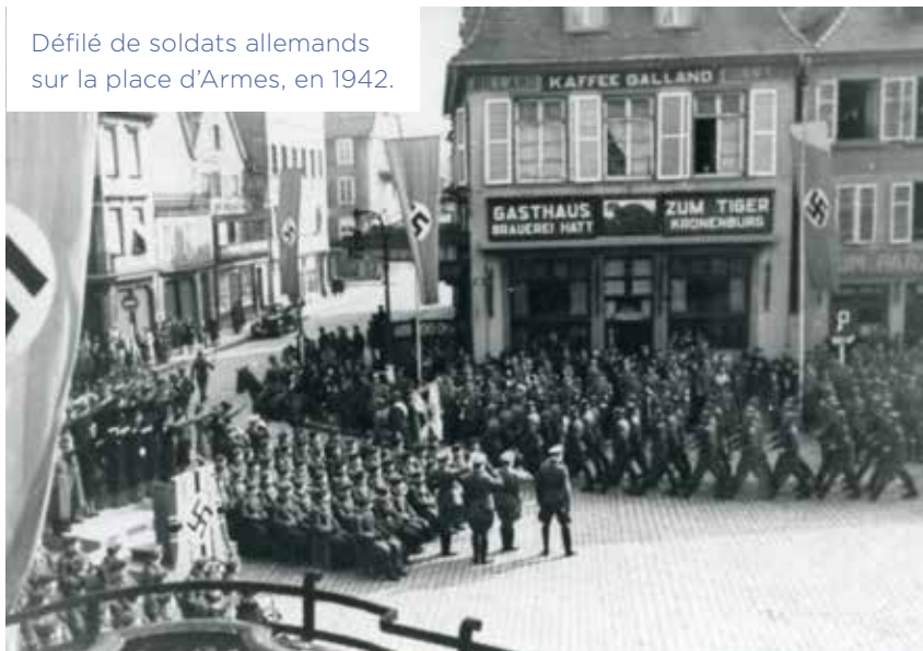
Défilé de soldats allemands sur la place d'Armes, en 1942.