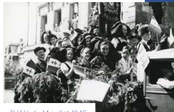
Défilé du 14 juillet 1945.