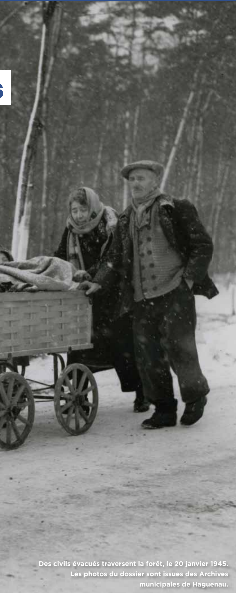
Des civils évacués traversent la forêt, le 20 janvier 1945.

C'est l'histoire d'une fausse joie ! Libérée le 11 décembre 1944 par les soldats de l'armée américaine, Haguenau se retrouve au cœur de l'opération Nordwind dès le 31 décembre. Après les terribles combats de l'hiver, la ville est à nouveau libérée, le 16 mars 1945. Cette fois, c'est la bonne !