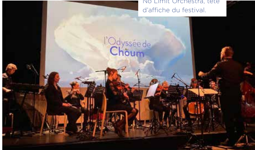
No Limit Orchestra, tête d'affiche du festival.