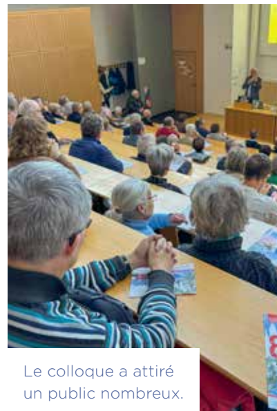
Le colloque a attiré un public nombreux.

Début février, la Société d'Histoire et d'Archéologie de Haguenau a organisé un colloque à l'IUT sur la thématique suivante : « Des horreurs de la guerre à la source créatrice de l'Europe » .