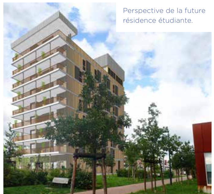
Perspective de la future résidence étudiante.

la Ville de Haguenau a décidé de céder le lot 08 de l'éco-quartier Thurot à l'association Amitel (déjà gestionnaire de la résidence pour alternants Alter et Toit). Ce terrain accueillera une résidence étudiante, complétant l'offre existante de logements pour jeunes dans notre ville, avec 35 logements locatifs aidés. Le bâtiment signal intégrera des espaces commerciaux en rez-de-chaussée pour dynamiser le quartier. La livraison du bâtiment est prévue en fin d'année 2027.