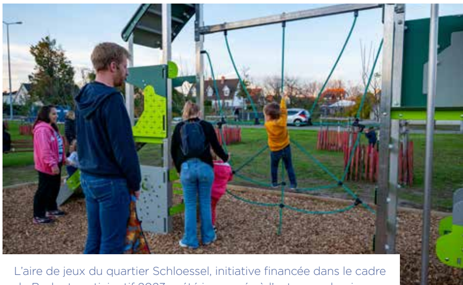
L'aire de jeux du quartier Schloessel, initiative financée dans le cadre du Budget participatif 2023, a été inaugurée à l'automne dernier.

« Chaque édition du Budget participatif est une formidable occasion de donner vie à des idées originales et utiles. Nous attendons avec impatience des propositions, pourquoi pas dans les domaines des arts ou de la culture ? »