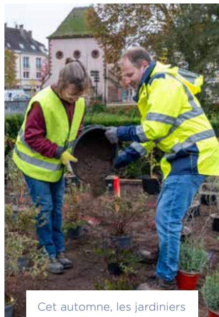
Cet automne, les jardiniers de nos deux Villes ont aménagé le rond-point de Landau à Haguenau, en mêlant symboliquement leurs terres.