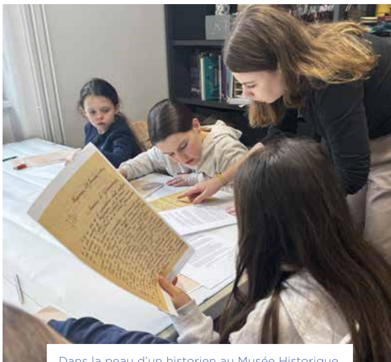
Dans la peau d'un historien au Musée Historique.

Un moment très attendu reste à venir : le mercredi 26 février, une visite en bus fera découvrir les lieux emblématiques de la Libération de Haguenau , avec des arrêts au Château Walk et sur le boulevard de la Libération, devant le mémorial de la Seconde Guerre mondiale.