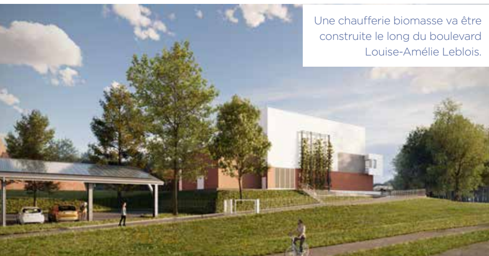
Une chaufferie biomasse va être construite le long du boulevard Louise-Amélie Leblois.

La Ville de Haguenau étend son réseau de chaleur avec 15 km de canalisations et une nouvelle chaufferie biomasse.