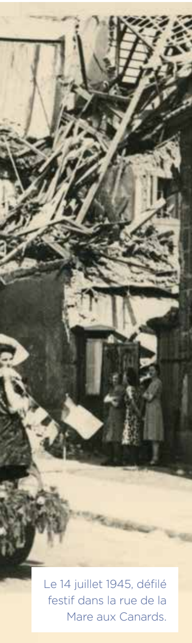
Le 14 juillet 1945, défilé festif dans la rue de la Mare aux Canards.