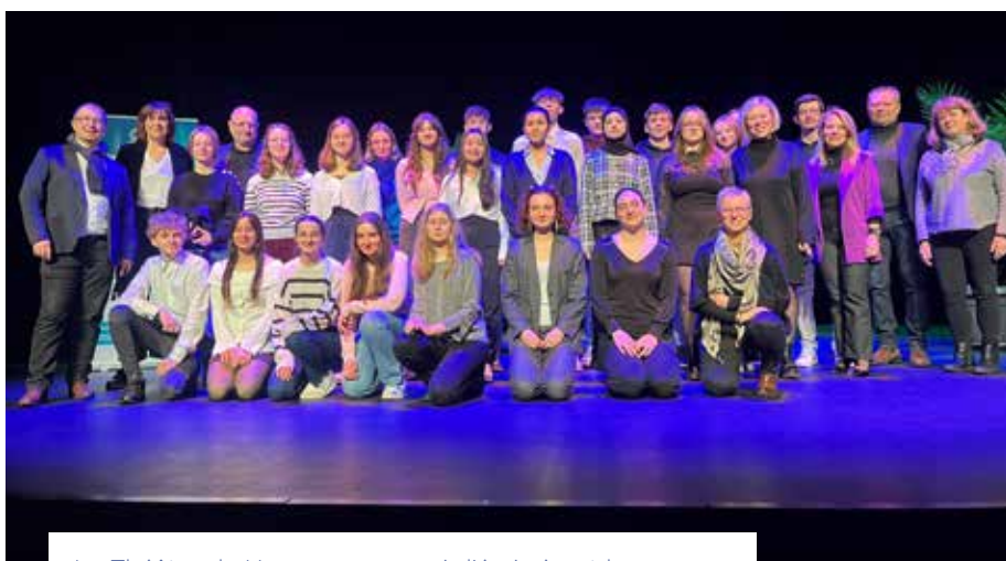
Le Théâtre de Haguenau a servi d'écrin à cet hommage.